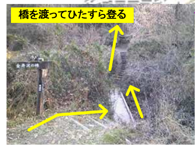
橋を渡ってひたすら登る