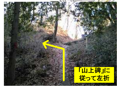
「山上碑」に従って左折