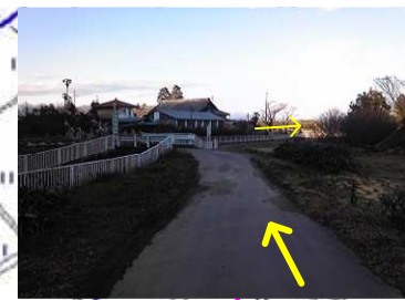
「二の丸跡」「土橋」「井戸跡」と過ぎ、「堅塚(タテグウ)」の先(トラロープあり)で「けもの道」に入る。