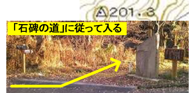
「石碑の道」に従って入る

ケガ その他困ったことの場合も、その場に留まり、ケータイ、ホイッスル、大声で連絡してください。