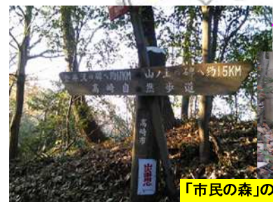
「市民の森」の案内があったらそれに従う。