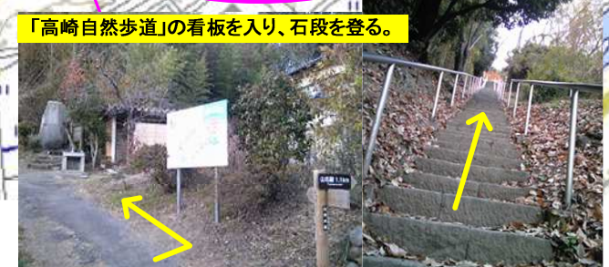
「高崎自然歩道」の看板を入り、石段を登る。