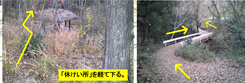
「休けい所」を経て下る。