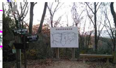
根小屋城址方面へ向かう。(金井沢碑への案内に戸惑わないように)