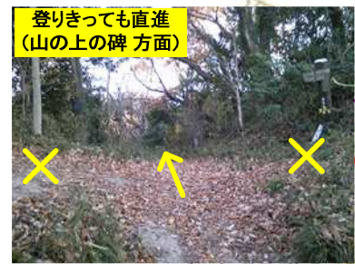
登りきっても直進(山の上の碑 方面)