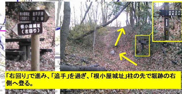
「右回り」で進み、「追手」を過ぎ、「根小屋城址」柱の先で堀跡の右側へ登る。